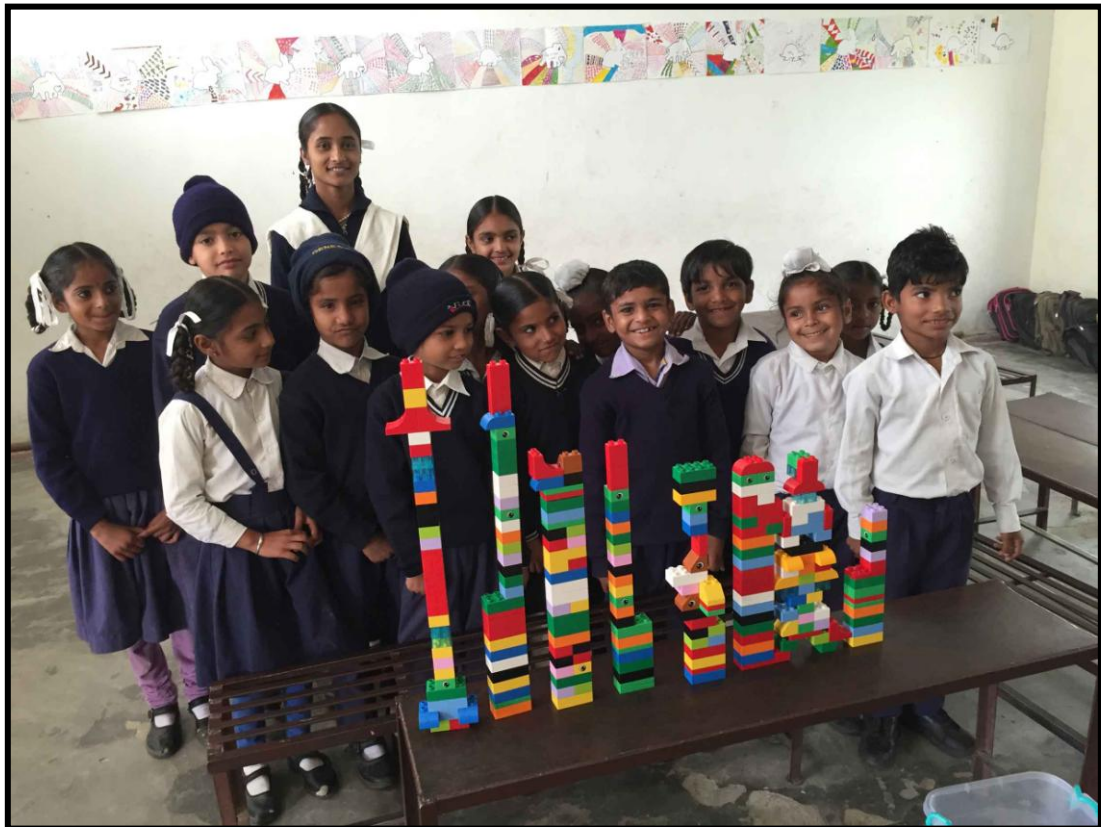
Sidst havde vi jo en masse Duplo med til skolen, så jeg havde forberedt mig til, at presenter dem for forskellige lærings lege, hvor i de kunne bruge Duplo klodserne...